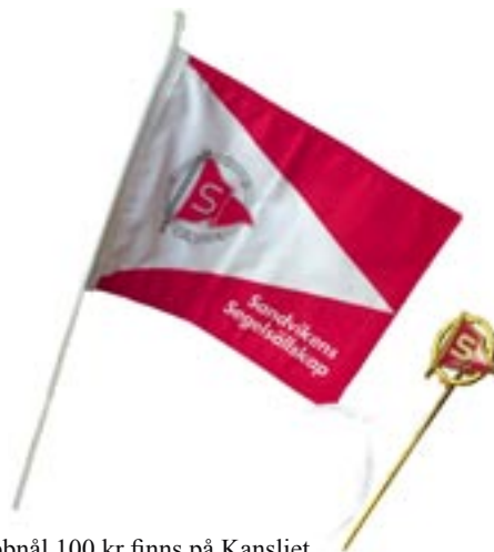
Vimpel 140 kr, klubb nål 100 kr finns på Kansliet.