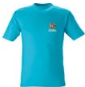
T-Shirt Aqua 115:- Strl. cl – vuxna

Prova storlekar och beställa kläder gör man på kansliet