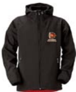
Jacka Soft shell 575:- Storl. cl – vuxen