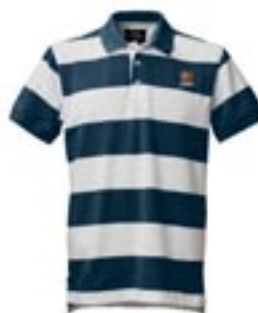
Piké 320:- Strl. xs – xxl