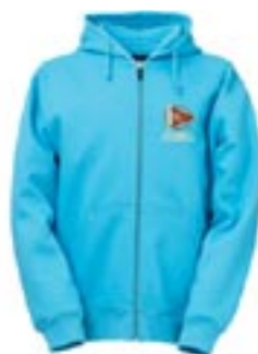
Huva Aqua ZIP 420:- Strl. cl – vuxna